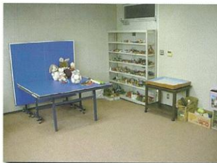
○ プレイルーム（2部屋）